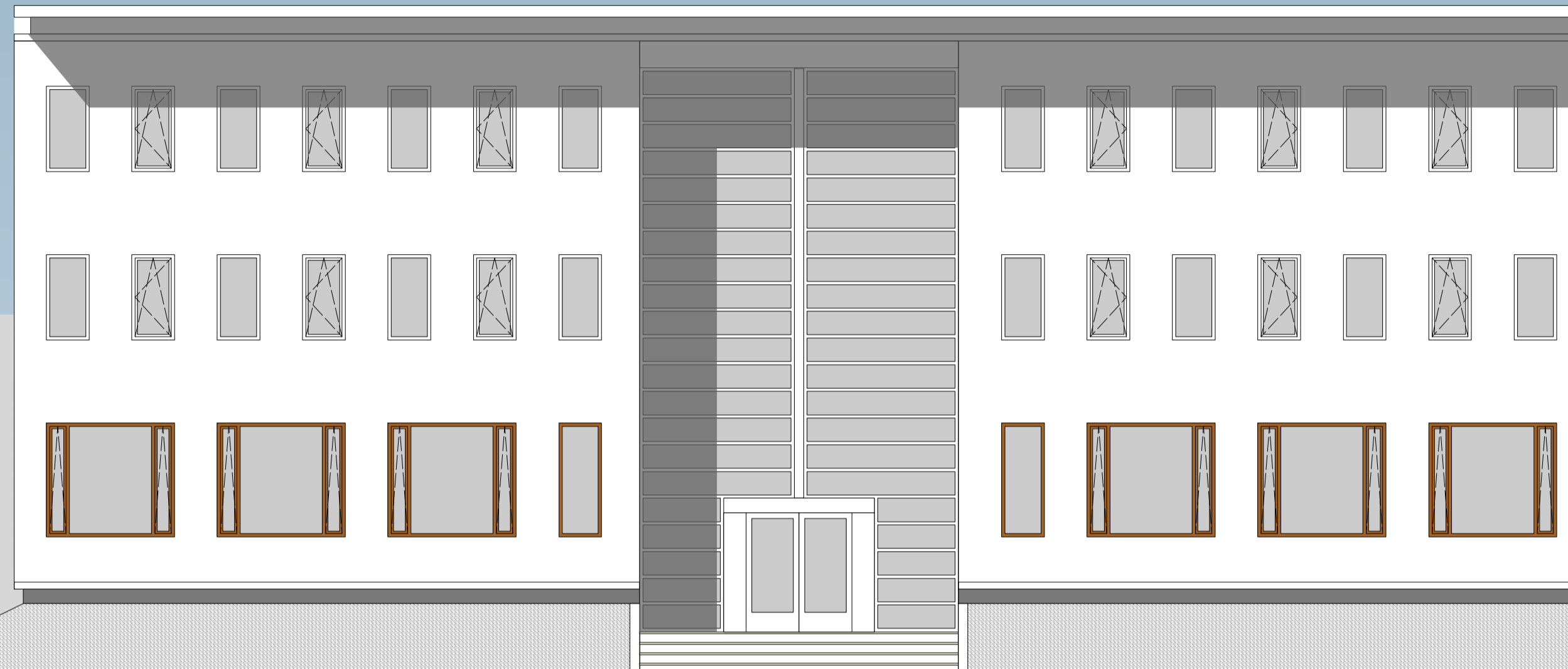
GEVELAANZICHT VANUIT HET OOSTEN