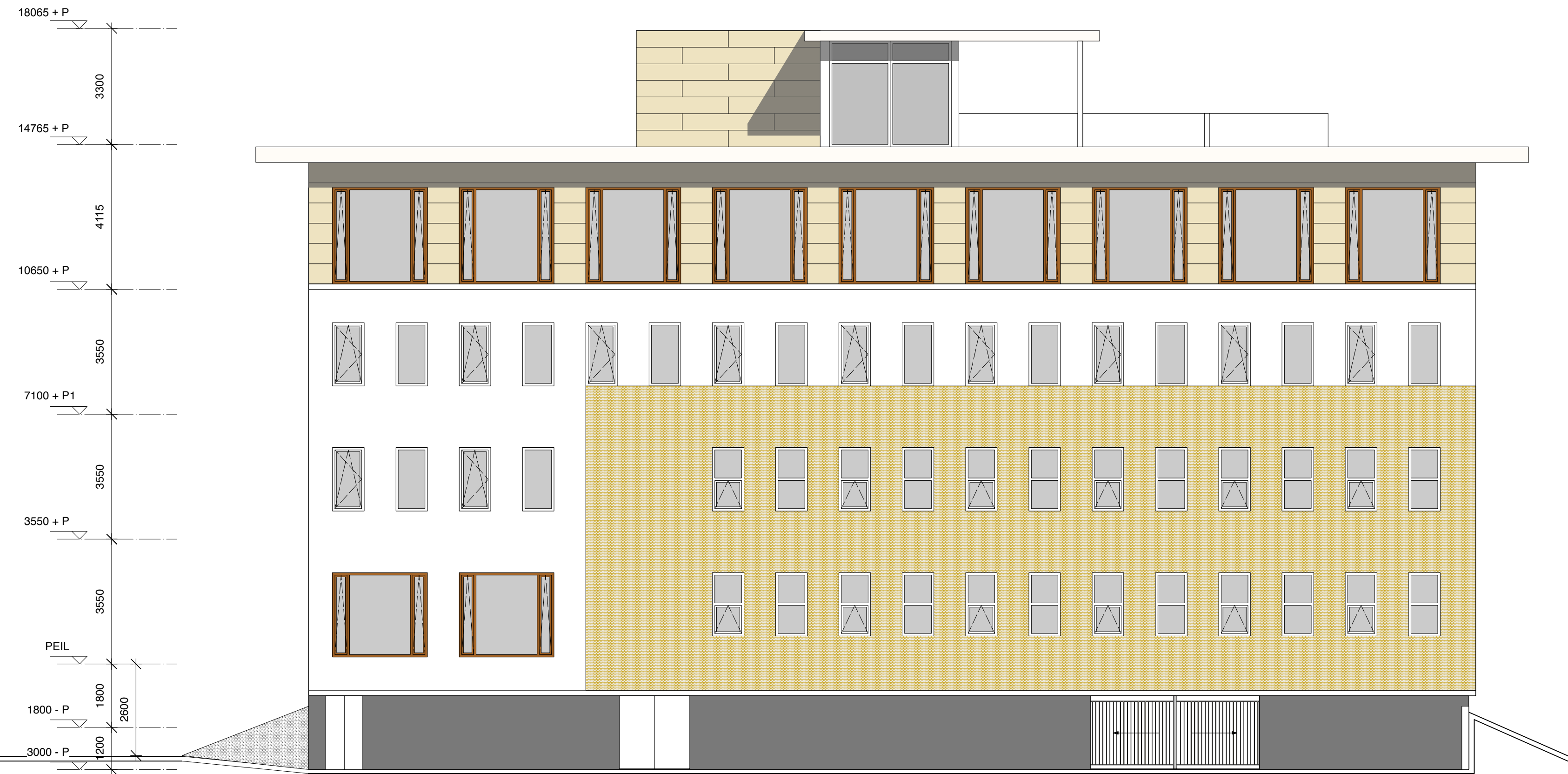
GEVELAANZICHT VANUIT HET NOORDEN