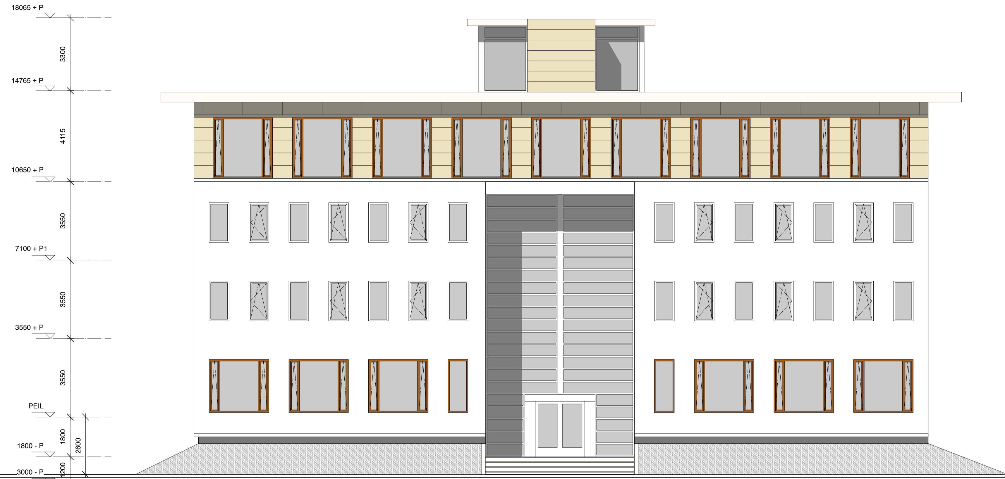
GEVELAANZICHT VANUIT HET OOSTEN